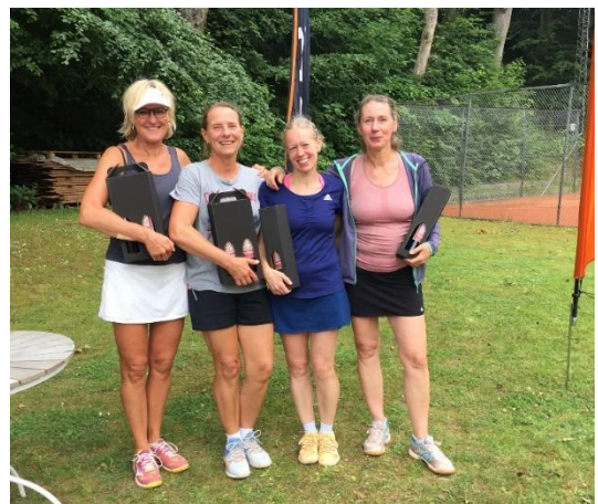
Se alle billeder fra JM ude 2018